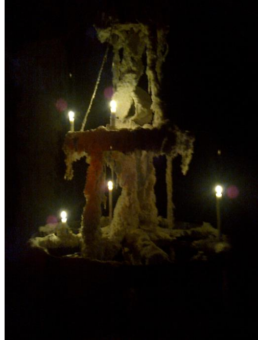
Flere af Christian Lemmerz' lysskulpturer

Efter det spændende besøg skulle vi finde et sted at spise vores medbragte mad. Vi havde håbet, at det kunne blive ude i det fri, men det regnede og var råkoldt, så vi fandt et lysthus som var et overdækket sted med bænke rundt langs væggene, temmelig åbent og ikke særlig hyggeligt, men vi fik da tænderklaprende spist vores mad. Herefter gik nogle på café for at få varmen, og andre tog hjem i deres varme stuer.