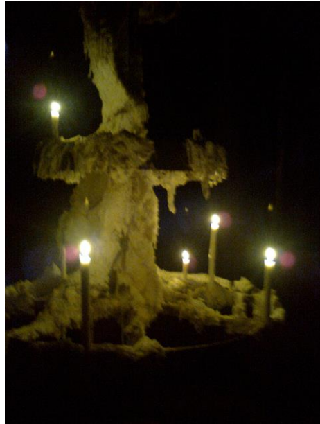
En af Christian Lemmerz lysskulpturer

Søndag d.11. maj besøgte vi Cisternerne, som er et vandreservoir, der forsynede København med rent drikkevand fra 1859 til 1933. Hele 16 millioner vand rummede cisternerne og var med til at løse datidens store vandforsyningsproblemer. ! 1981 blev Cisternerne tømt for vand og i forbindelse med at København var Kulturby i 1996, blev Cisternerne taget i brug som udstillingssted efter initiativ fra Frederiksberg kommune. Galleriejer Max Seidenfaden drev Cisternerne som museum for moderne glaskunst fra 2001 til 2003.